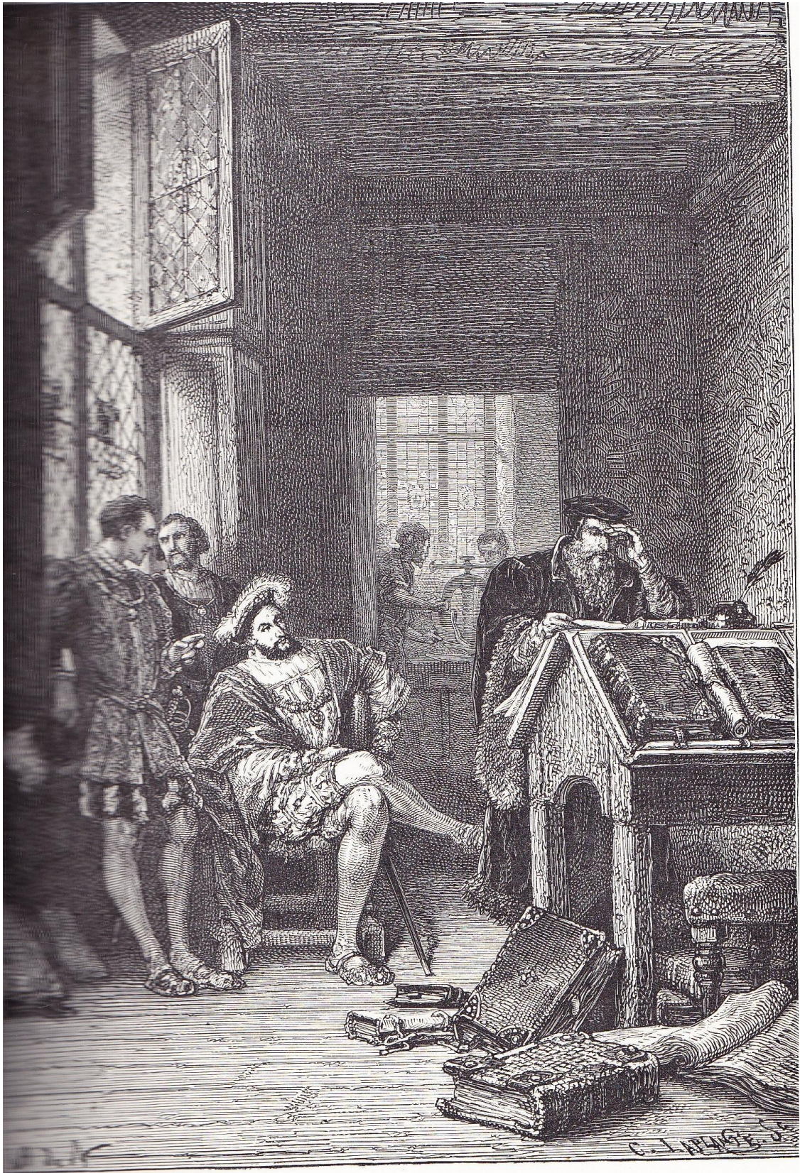
FRANÇOIS 1 er DANS L'ATELIER DE ROBERT ESTIENNE.

« François 1 er dans l'atelier de Robert Estienne »