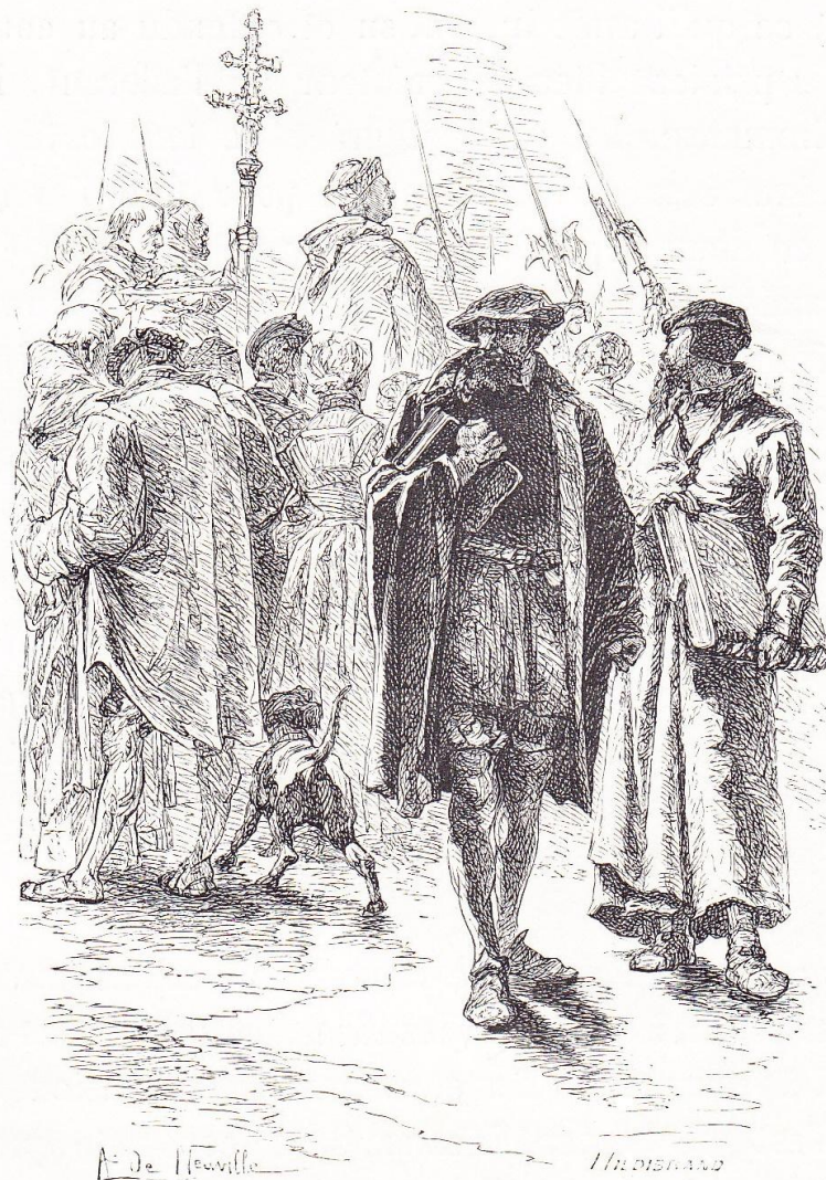
LES PREMIERS PROTESTANTS

pliquée, jusque-là livrée aux coups et aux hasards de la force, mais intellectuellement très-vivante et très-ambitieuse, travaillée du double besoin de se réformer et de se régler, et qui tenta en effet, au seizième siècle, une réforme à la fois religieuse et politique dont le but, manqué à cette époque, est encore au fond de toutes nos épreuves et de tous nos efforts. C'est de ce grand travail du seizième siècle que je vais essayer d'assigner avec précision le caractère et de marquer les premiers pas.